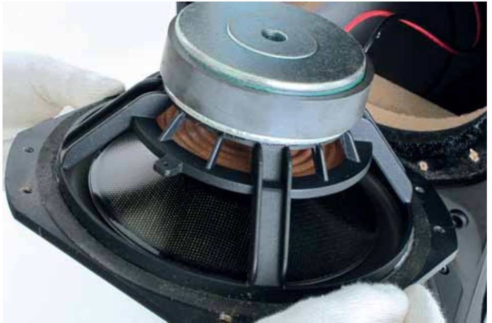
Particolari del mid woofer, dei due woofer in parallelo, e del condotto di accordo anteriore sotto di essi.

ben resa. Davvero molto bene per un diffusore economico, ma in questo caso è il posizionamento dei due accordi acustici, sia quello del mid che quello vero e proprio del bass reflex, a fare la differenza oltre alla scelta dei due woofer in parallelo, che crea un carico più gestibile per l'amplificazione.