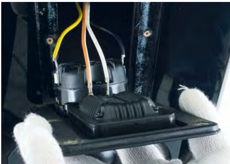
Particolare del Tweeter a nastro con un altoparlante classico a supporto.

tore McIntosh collegato tramite cavi bilanciati White Gold Reference Celestial al poderoso finale Edge NL 12.2 da "soli" 400 Watt per canale su 8 ohm; cablaggio di alimentazione e potenza sempre White Gold Reference Celestial. L'inspostabile Edge ed il resto delle elettroniche hanno preso posto sui dei bei porta elettroniche Music Tools.